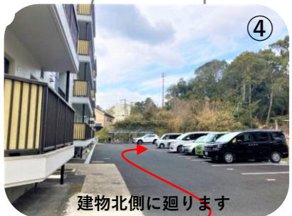
④ 建物北側に回ります