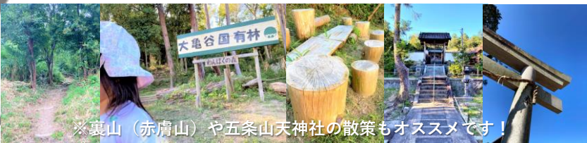
※裏山（赤膚山）や五条山天神社の散策もオススメです！