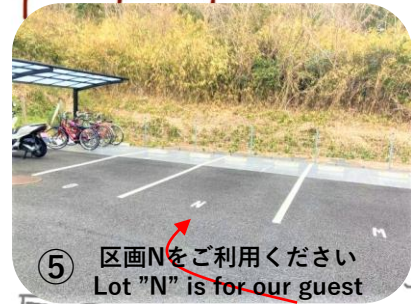
⑤ 区画Nをご利用ください Lot "N" is for our guest