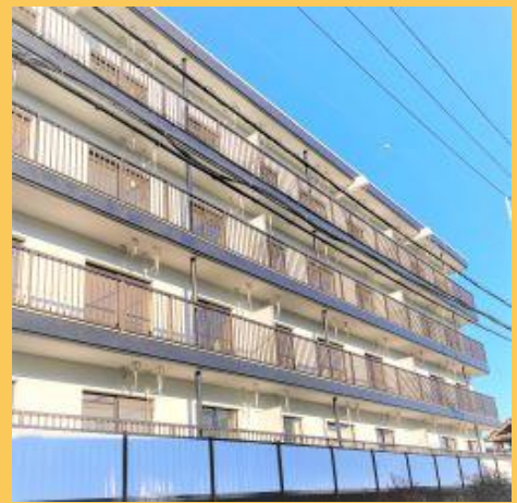
こちらの建物の1階です↑

※空き状況は保証いたしかねます → Parking for 2 nd car may be available →